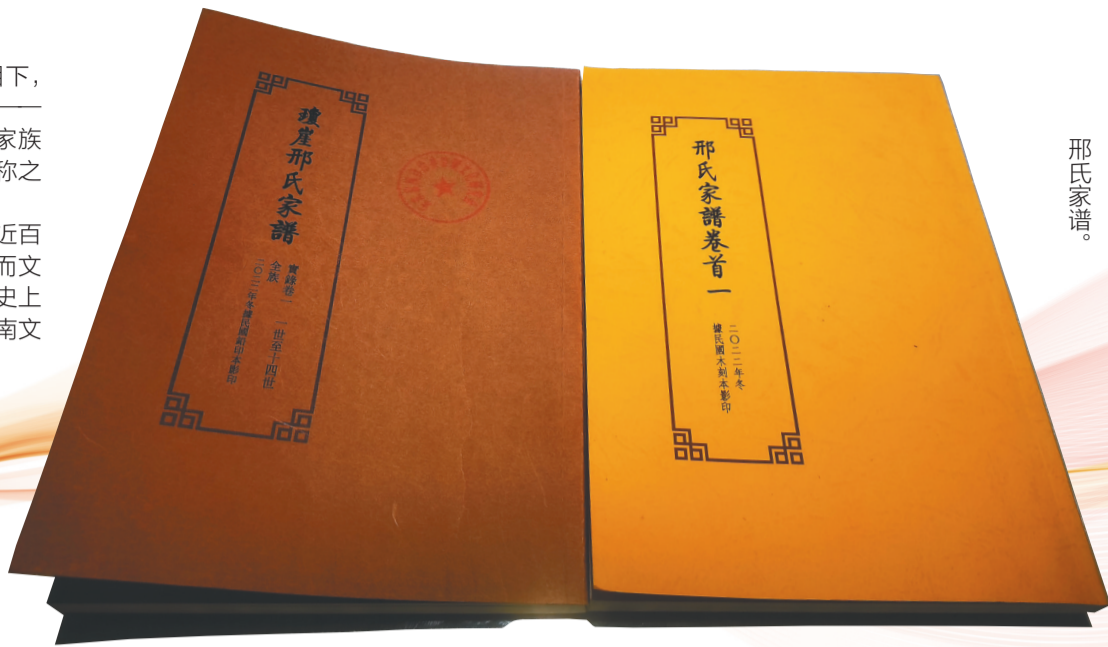
邢氏家谱。

从邢瀚到邢世灵，四代人跨越明朝中期到明末近百年，代代中举。邢氏家族明清两代共有九名举人，而文昌蛟塘村邢瀚一家，就贡献了四位。这在海南科举史上极为罕见。他们不仅是科举制度的受益者，更是海南文教兴盛的见证者和推动者。