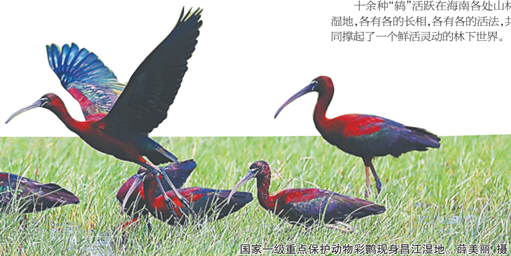
国家一级重点保护动物彩鹮现身昌江湿地。

鸟羽的色彩,是鸟类在演化中写下的生存密码,每一种颜色都有其缘由,每一根羽毛都记录着活下去的故事。□