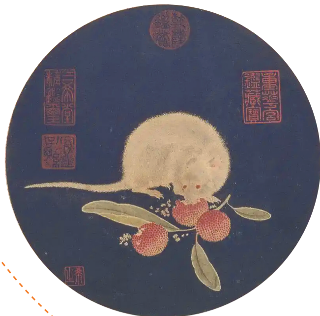
朱瞻基(明)《三鼠图册之食荔枝图》。