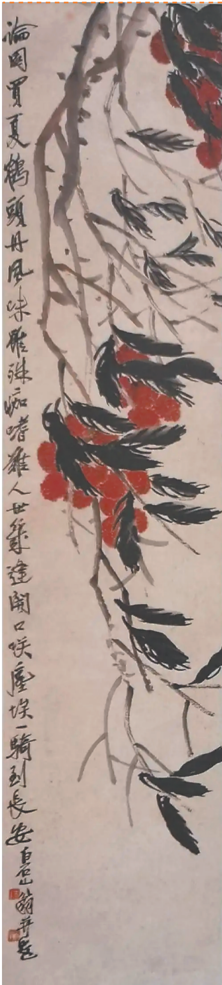
齐白石《荔枝》。

1980年1月，齐白石所作《荔枝图》被印成邮票发行。这使得荔枝在国画中真正从“庙堂之高”进入了“江湖之远”。