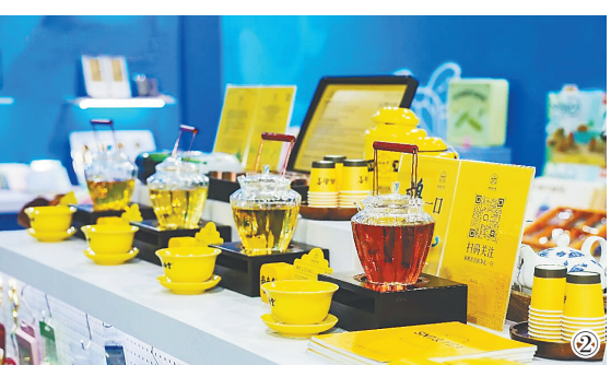
②活动展销的海南鹧鸪茶产品。