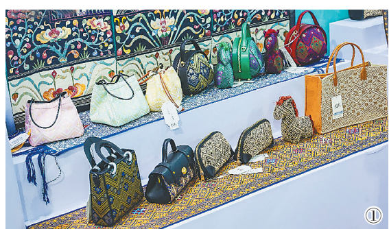
①活动展销的特色黎锦包包。

现场爆款产品一个接一个。保亭的“墨纹黎韵”包包,黎锦纹样“撞上”现代包型,由于太热门不得不“限购”;“听海香堂”品牌沉香、黎锦图腾和苏东坡故事装进一只随身香炉,这份东方雅致让外国游客爱不释手;