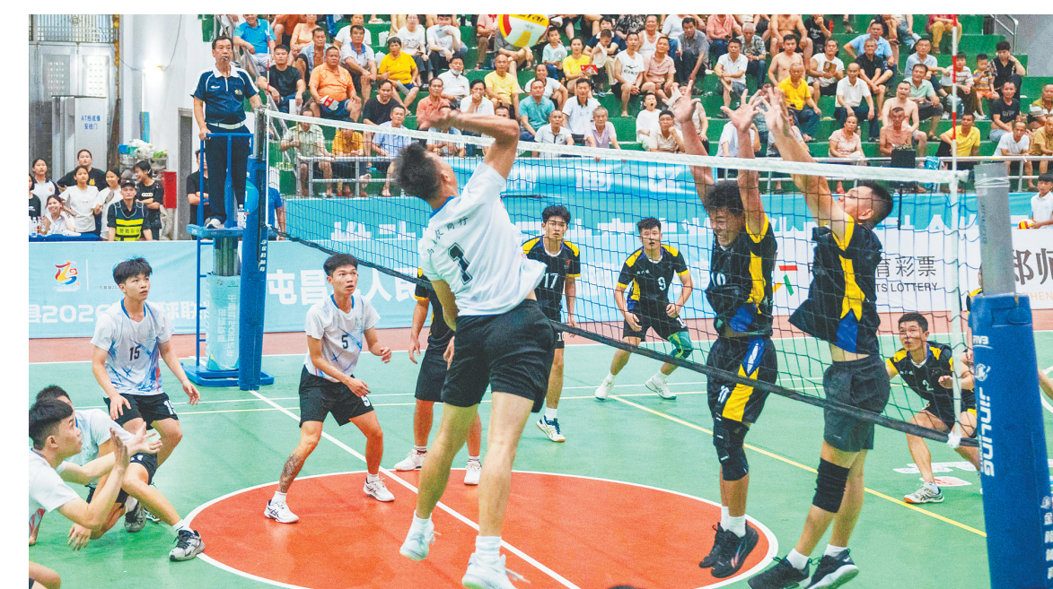
屯昌“村VA”总决赛现场。

比赛一开始,新兴镇队队员很快进入状态,凭借强攻及交叉快攻等战术拿下前两局。第三局,乌坡镇队强化了跳发球以及拦网等战术,艰难地挽回一局。第四局,乌坡镇队的攻防显得更从容,再赢下一局。到了最为关键的第五局,双方队员体力消耗都很大,但大家都铆足一股劲,频频上演跳发球及攻防多个来回的精彩时刻,双方比分紧咬不放,交替上升。最终,乌坡镇队以21:19险胜新兴镇队,上演了“让二追三”的好戏。值得一提的是,在4月12日举行的揭幕赛上,乌坡镇队同样“让二追三”战胜屯昌中学队。当晚,在总决赛第三四名争夺战中,坡心镇队以3:1战胜海南屯昌思源实验中学队。