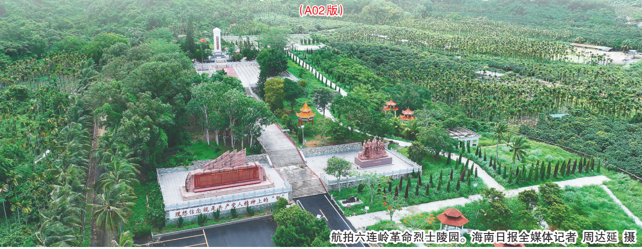
航拍六连岭革命烈士陵园。