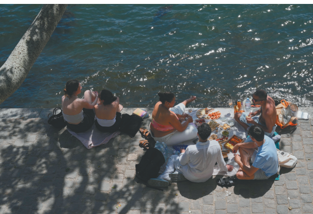
5月25日，人们在法国巴黎塞纳河畔野餐。