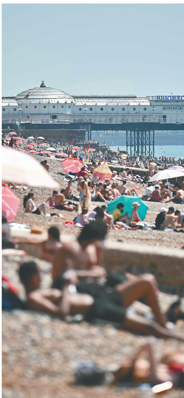
5月25日，在英国布赖顿，人们在海边休闲。