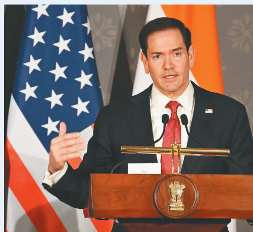
5月26日，美国国务卿鲁比奥在印度新德里出席新闻发布会。

多家媒体和政治分析师认为，特朗普把所谓“亚伯拉罕协议”与美伊协议“捆绑”，意在借机向相关中东国家施压，为以色列谋求利益，同时遏制伊朗未来发展。但沙特等国本就反对所谓“亚伯拉罕协议”，近来又因美国对伊朗动武而遭受巨大损失，对于特朗普此举普遍反应冷淡。