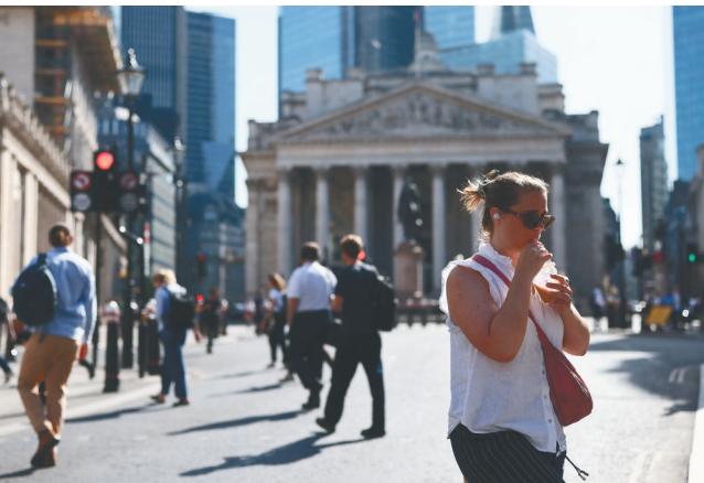
5月26日，在英国伦敦，一名女子喝冰饮解暑。(新华社/路透)