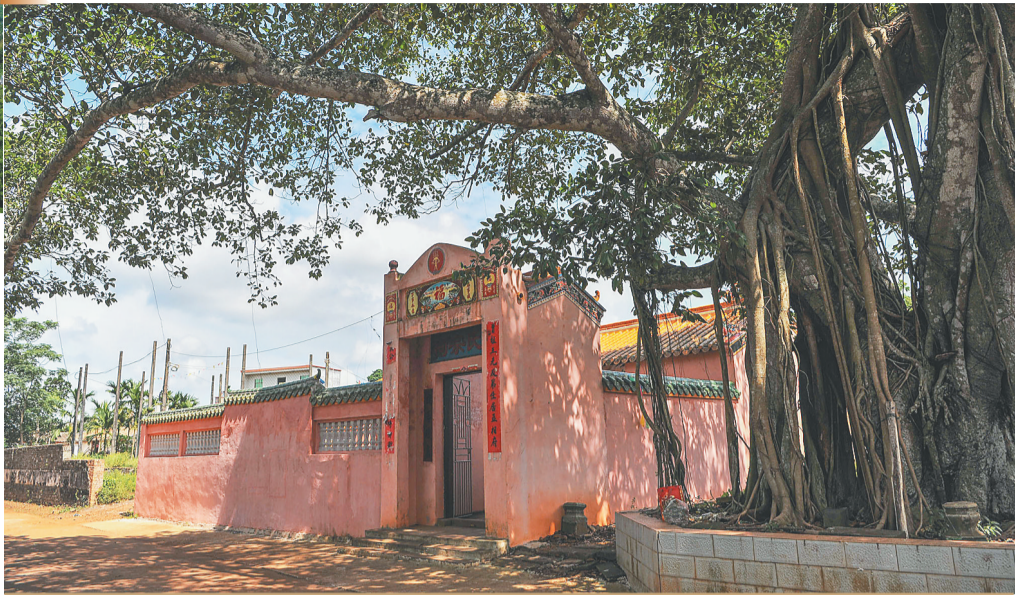
位于海口市琼山区三门坡镇青草村的王氏宗祠。