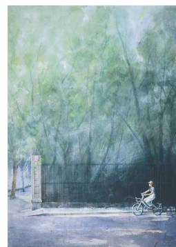
李朝繁《夏日》。