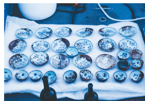
图为从挪威斯卡格拉克海峡一艘沉船上打捞出的中国瓷器。

据新华社奥斯陆6月2日电（记者张玉亮）挪威考古人员近日在该国南部海域发现一艘18世纪的沉船，从船上打捞出大量保存完好的中国瓷器，并将其命名为「瓷器沉船」。考古人员说，北欧地区此前从未发现过可与之相媲美的沉船宝藏。