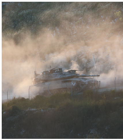
5月31日在以色列黎巴嫩临时边界拍摄的以色列军事车辆。