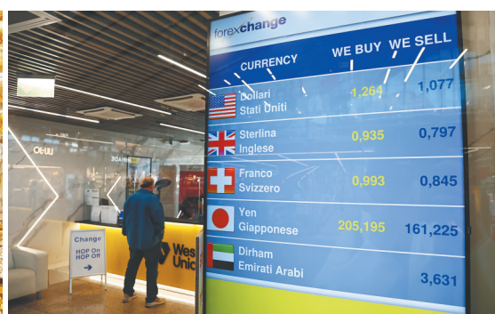
在意大利首都罗马，游客在一家外币兑换点办理业务。