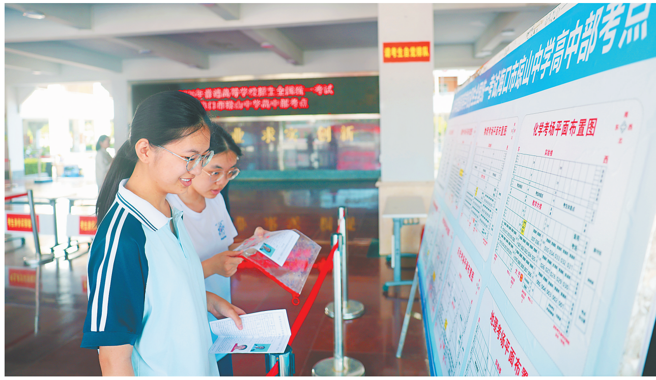
提前踩点 从容应考

动型开放，加快建设具有世界影响力的中国特色自由贸易港。检查组将全力支持于监督之中，认真研究执法检查中发现的新情况新问题，积极推动有关部门调整优化政策举措，更好助推高标准建设海南自由贸易港。 全国人大财经委副主任委员田国立，全国人大常委会委员、财经委员欧阳昌琼，全国人大财经委委员赵海英，全国人大代表刘飞香、陈凡等参加检查。国家发改委副主任王昌林参加有关活动。 省领导范少军、符彩香、孙大海、宋健、赵峰参加有关活动。