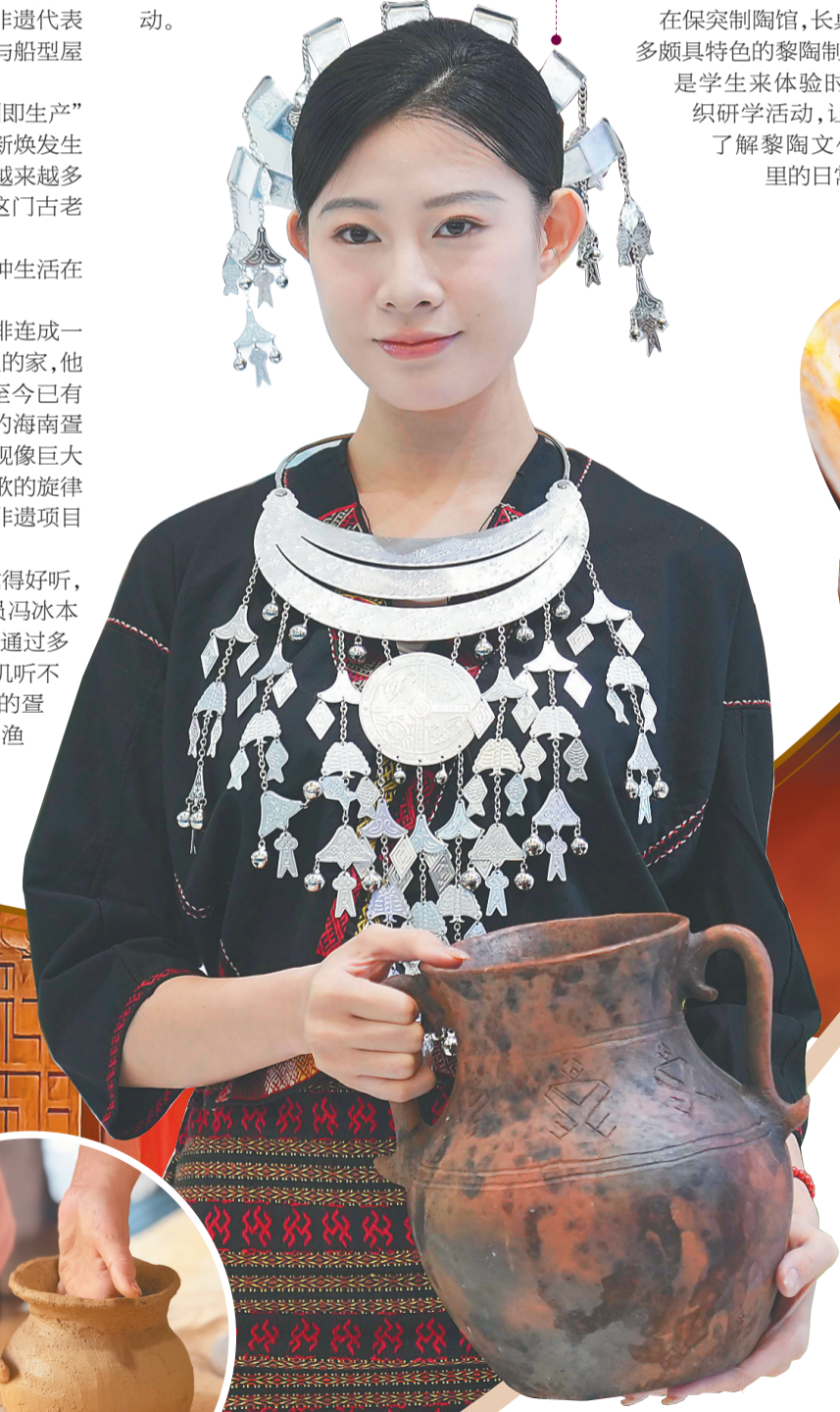
一位身着黎锦的模特。