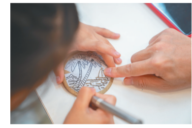
一名小朋友在完成椰雕作品。

在海南,非遗的传承,是技艺的延续,也是文化的共享。 在昌江黎族自治县石碌镇保突村,沿着村道往里走,一座用茅草铺顶的建筑便是保突村制陶馆。 2006年,黎族原始制陶技艺被列入第一批国家级非物质文化遗产名录,其魅力在于“原始”。这里采用的“泥条盘筑法”是中国最古老的制陶手法之一——不使用电动转盘,全凭一双手,将陶土搓成泥条,盘绕垒起,再用贝壳刮平缝隙。 2025年4月,保突村制陶非遗工坊成为海南唯一入选全国第二批“非遗工坊典型案例”的项目。在这里,从揉泥、盘筑到修坯,访客可参与制陶全流程,还可在作品上刻画个人喜爱的图案。 黎族原始制陶技艺省级代表性传承人黄玉英,16岁起随母学习制陶,迄今已守护这门手艺40余年。她牵头成立合作社与个人工作室,带动保突村及周边村庄的村民传承发展黎陶技艺。 在保突制陶馆,长桌上摆放着许多颇具特色的黎陶制品,其中不少是学生来体验时的作品。组织研学活动,让更多年轻人了解黎陶文化,已成为这里的日常。