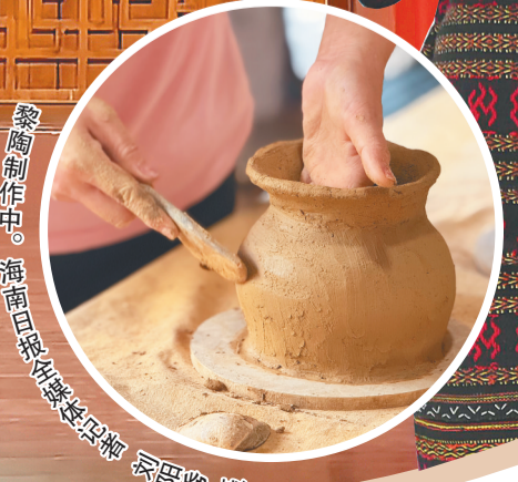
黎陶制作中。