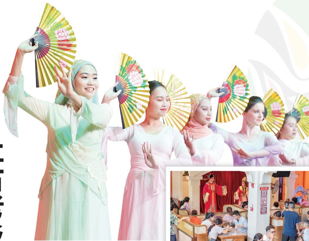
来华留学生唱琼剧。