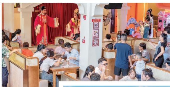
老爸茶店里的琼剧演出。