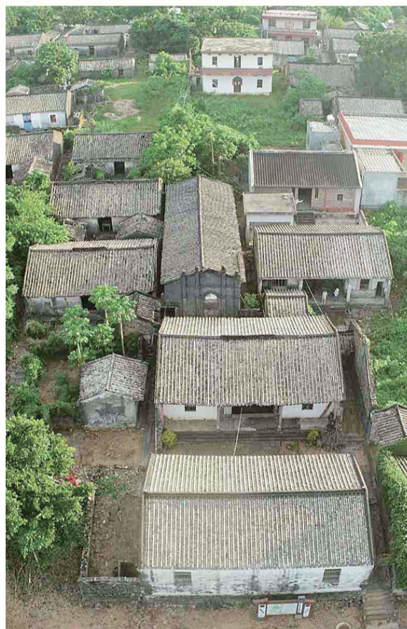
王映斗故居修缮前俯视图。 资料图