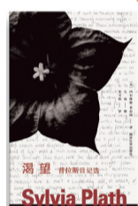
作者：「美」西尔维娅·普拉斯 编者：久枝 译者：朱雪峰 版本：南京大学出版社 时间：2026年5月

西尔维娅·普拉斯（1932年—1963年）曾被乔伊斯·卡罗尔·欧茨形容为“战后英语诗坛最负盛名且最具争议的诗人之一”。她是杰出的诗歌大师，有着独一无二的诗歌声音，一度被认为是“自白派”诗歌的核心人物，也因作品中深刻的女性意识，成为现代文学与女性研究中不可或缺的文化符号。本书选编了这位诗人1950年至1962年的日记，揭示了她在个人生活和文学创作上的激烈挣扎，还原了她有意识的风格练习与灵感诞生的轨迹。