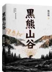
作者：陈应松 版本：长江文艺出版社 时间：2026年3月

“在最艰难偏远的地方，往往有最圣洁高尚的生命，我要向那些简单而坚韧的生活致敬，向命运中沉默的力量致敬。”《黑熊山谷》是陈应松“神农架系列”的又一力作，小说根植山林又超越山林，以黑熊山谷的开发、保护与重建为主线，描写了在黑熊山谷中坚守土地又不断抗争的劳动人民。小说抒发着人们对故乡、土地和劳动的挚爱。