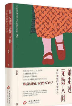
《她走过无数人间：萧红和她的文学世界》 作者：张莉 版本：北京十月文艺出版社 时间：2025年11月

常聚焦于其坎坷的情感经历与悲情命运，却忽略了她作为一位独特文学世界创造者的力量。张莉写道：“萧红一生都在逃离，逃离封建家庭，逃离束缚人性的婚姻，她终其一生都在寻找自由，寻找写作的尊严。”从《生死场》到《呼兰河传》，从《商市街》到《马伯乐》，即便在贫病交加、漂泊无依的岁月里，她也从未放下手中的笔。她在致萧军信中写下：“我不能选择怎么生，怎么死，但我能选择怎么爱，怎么活，这就是我的黄金时代。”这正是她一生的写照。她的特别之处，在于始终直面那困扰她一生的伤口、屈辱与挣扎，把最真实的生命体验，化作独特的文学视角，一字一句书写人间百态。