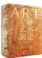
作者：「美」玛丽莲·斯托克斯塔 译者：王春辰等 版本：中信出版社 时间：2026年5月

一部立足于全球文明视野的巨著，第七版全新升级。全书20章、100万字，约700幅高清图，来自全球160余座博物馆、美术馆——打破西方中心论，东西方艺术并重。20余年、100余位专家持续修订，第七版是国内少数系统全面更新的版本，与全球前沿研究同步。内容从史前文明到21世纪当代艺术，并拓展至亚洲、非洲、拉丁美洲及女性艺术家。