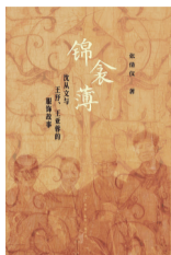
作者：张倩仪 版本：生活·读书·新知三联书店 时间：2026年3月

1953年的一次午门邂逅，开启了沈从文、王弼、王亚蓉三人小组筚路蓝缕的服饰研究与纺织考古之路。作者以珍贵的一手资料，加之深入的研究与采访，写下了沈从文服饰小组长达几十年的动人故事。