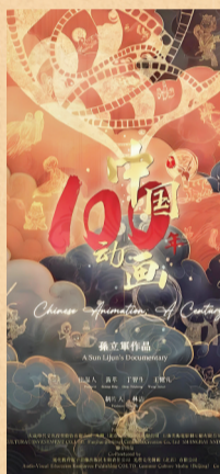
纪录片《中国动画100年》海报

《中国动画100年》这部纪录电影具有知识传播的价值,但它并不“高冷”,而是更像一位温柔的故事讲述者,将中国动画的百年经历娓娓道来。这部纪录片让中国动画电影的观众们“知其然,知其所以然”:既让观众在观看经典动画电影的片段中重温童年时光,又带领观众看到动画鲜为人知的制作过程。无数前辈的匠心和百年的创新造就了此刻高光的国漫崛起。在这个意义上,《中国动画100年》既是一部回望百年动画美学长征的纪录电影,又是给所有动画粉丝一份珍贵的“周边物料”。