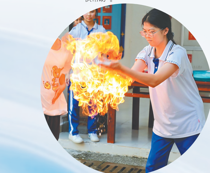
保亭学生开展化学实验“火焰掌”。

操场上，一架无人机腾空而起。紧接着，另一架无人机凌空起舞，一连串高难度动作行云流水……“哇，它们好像在跳舞！”孩子们的目光齐刷刷追随空中的无人机。 这个热闹场景日前发生在海口市西湖实验学校首届科技节活动现场，成为海南中小学科技节浪潮的生动缩影。 日前，以“科创赋能自贸港 少年逐梦向未来”为主题的首届海南省中小学科技节主场活动在海南科技馆开幕，文昌市、昌江黎族自治县、三亚市崖州区、五指山市同步设立分会场，让科学的种子在学生心中生根发芽。 据介绍，在省级层面首设中小学科技节，是我省教育系统按照省委、省政府的决策部署，统筹推进教育科技人才体制机制一体改革，特别是在“双减”中全力做好科学教育“加法”的生动体现。