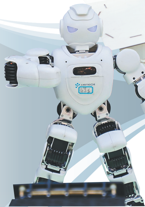
科技节活动上的机器人技能展示。