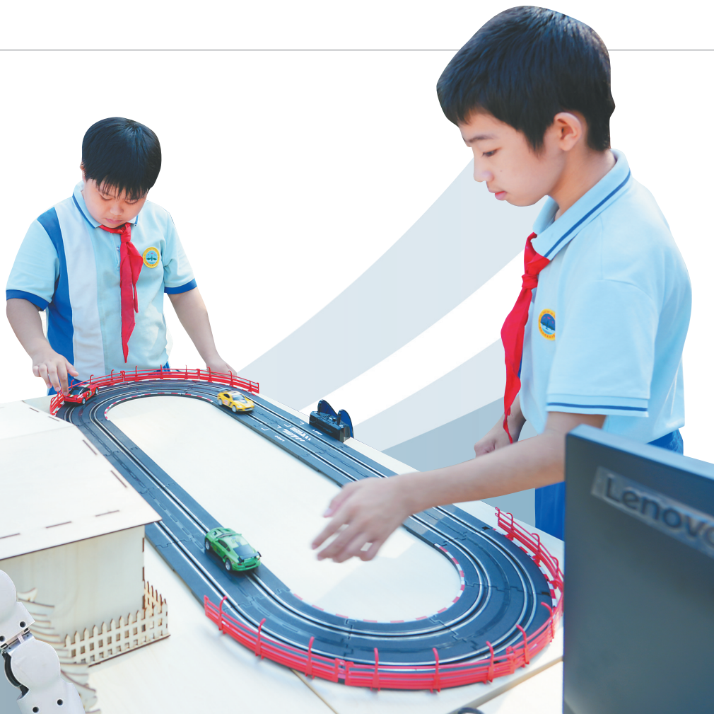
五指山市学生体验轨道赛车项目，感受科技带来的乐趣。