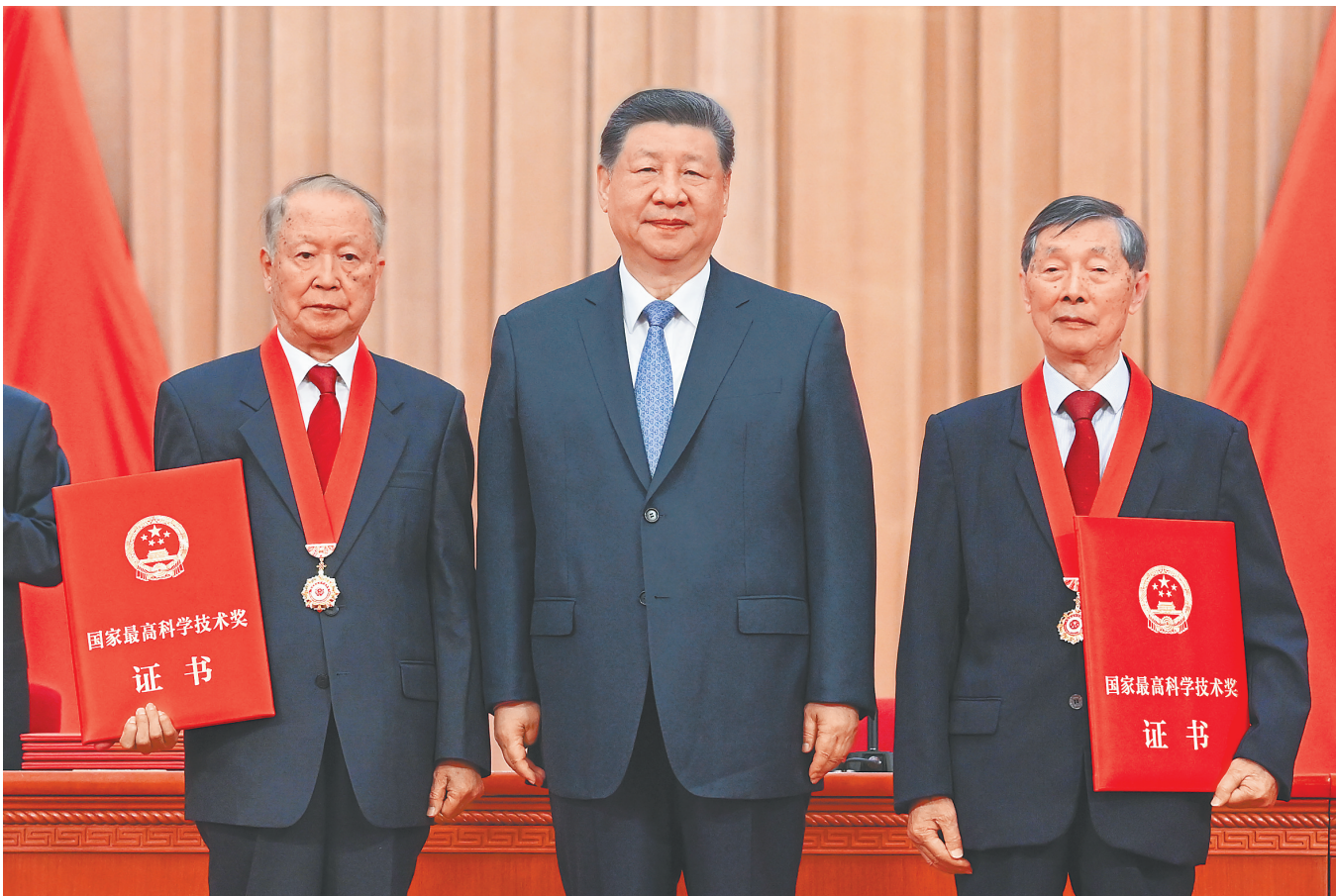
7月8日上午，国家科学技术奖励大会、中国科学院第二十二次院士大会和中国工程院第十八次院士大会、中国科学技术协会第十一次全国代表大会在北京人民大会堂隆重召开。中共中央总书记、国家主席、中央军委主席习近平向获得2025年度国家最高科学技术奖的中国科学院物理研究所陈立泉院士(右)和中国电子科技集团第十四研究所贲德院士(左)颁奖。

术奖励的决定》。 仪式号角响起，习近平首先向获得2025年度国家最高科学技术奖的中国科学院物理研究所陈立泉院士和中国电子科技集团第十四研究所贲德院士颁发奖章、证书，同他们热情握手表示祝贺。随后，习近平等党和国家领导人同两位最高奖获得者一道，为获得国家自然科学奖、国家技术发明奖、国家科学技术进步奖和中华人民共和国国际科学技术合作奖的代表颁发证书。 在热烈的掌声中，习近平发表重要讲话。他指出，党的十八大以来，党中央把科技创新摆在现代化建设突出位置，系统擘画科技强国建设蓝图，深入推动实施创新驱动发展战略，全面深化科技体制改革，推动科技事业取得历史性成就、发生历史性变革。我国正从全球科技参与者、贡献者向开拓者、引领