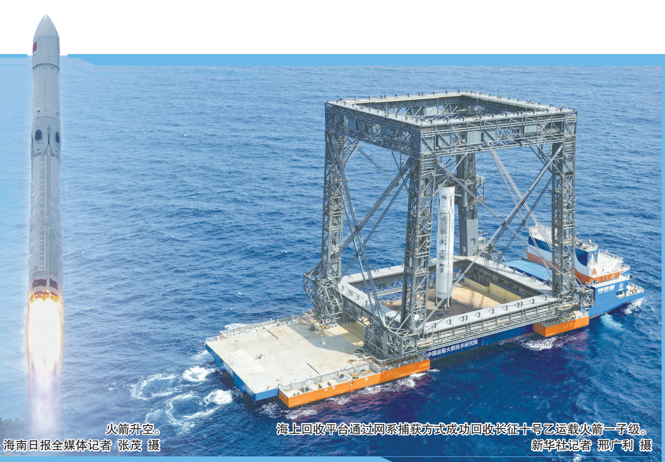
7月10日，长征十号乙运载火箭在海南商业航天发射场发射。

省委常委、常务副省长巴特儿担任此次任务指挥长，航天科技集团董事长陈鸣波、副省长杨国强以及国家航天局有关同志现场观摩。