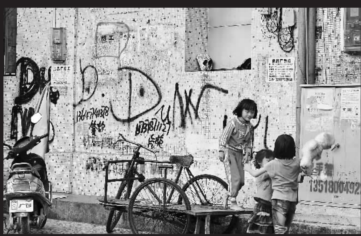
↑定安:定城镇人民中路。 本报记者古月摄于10月26日