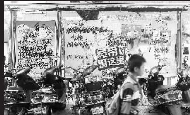
↑儋州:那大镇解放北路一公交车站。 本报记者苏晓杰摄于10月26日