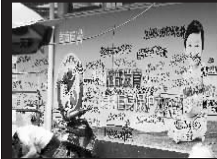
↑澄迈:金江镇立新路一宣传栏。