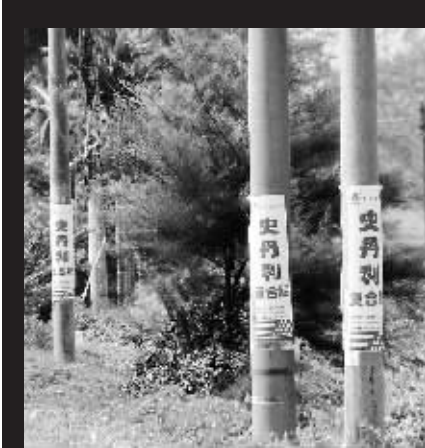
↑省道:海榆东线文昌到琼海路边的电杆被贴上野广告。 本报记者古月摄于10月26日