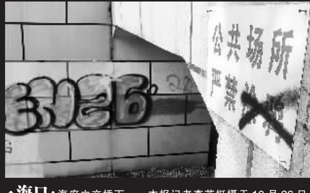
↑海口:海府立交桥下。 本报记者李英挺摄于10月26日