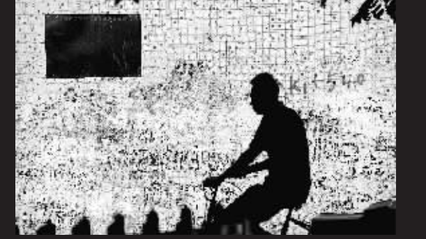
↑三亚:河西区光明社区。 本报记者苏建强摄于10月26日