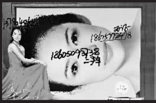
↑琼海:宝钢路。 本报记者古月摄于10月26日