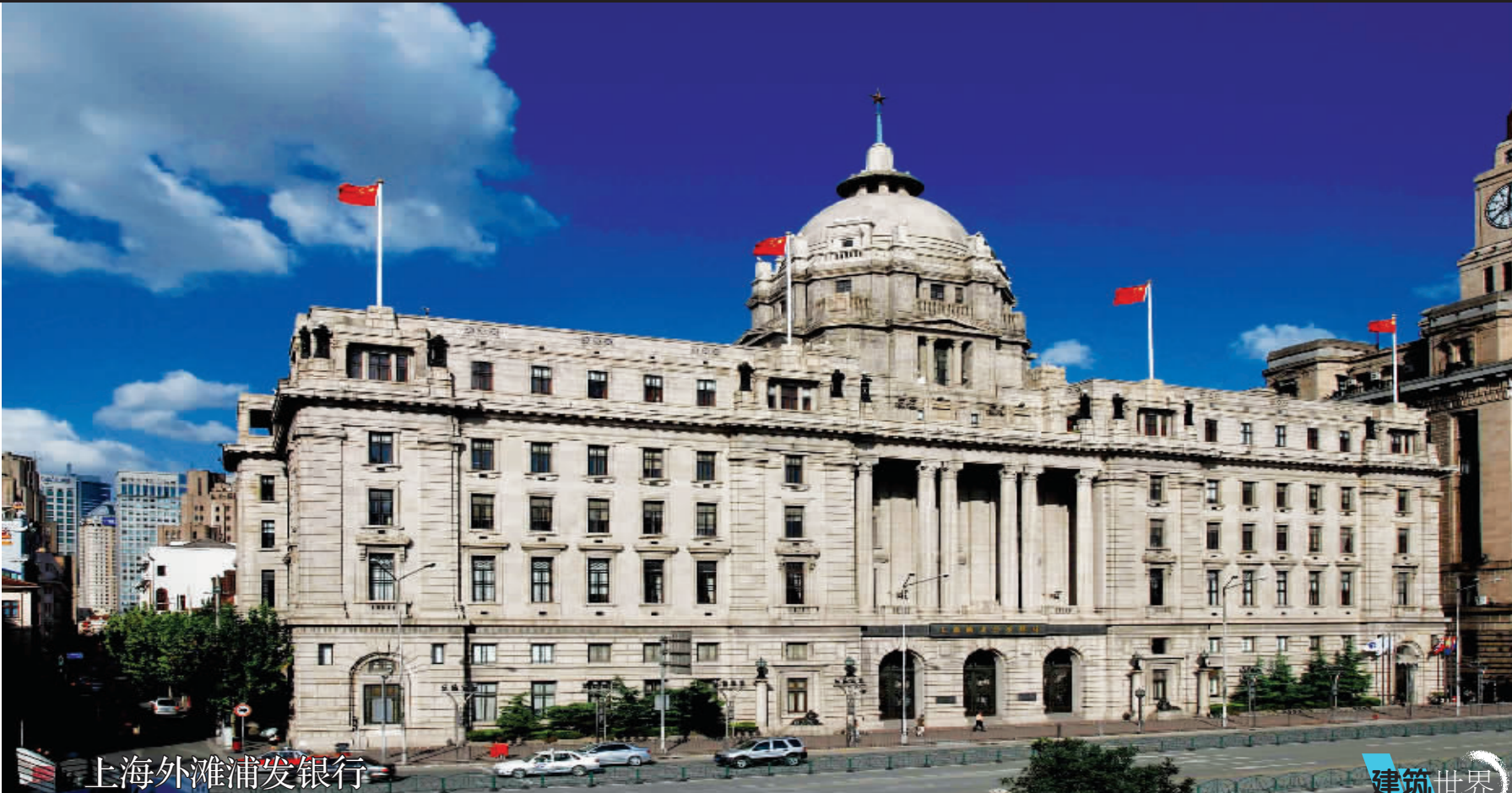
上海外滩浦发银行是一幢花岗岩垒砌的古希腊风格建筑,属于外滩万国建筑群之一,有着醒目标志和历史意义。大楼原系汇丰银行上海分行,新中国成立时这里曾为上海市人民政府所在地。

位于海南岛西北部的儋州,是海南省经济第三大市,与海口、三亚成三足鼎立之势。作为整个海南西部的核心城市,儋州正随着整个海南西部的开发,政府的规划和大力投入,给经济发展带来了无限生机。