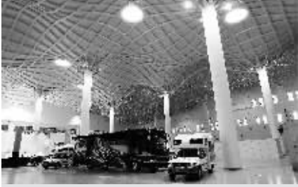
2011年体博会国际房车及露营地项目展区。