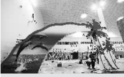
2011年体博会中国体育旅游精品展区。