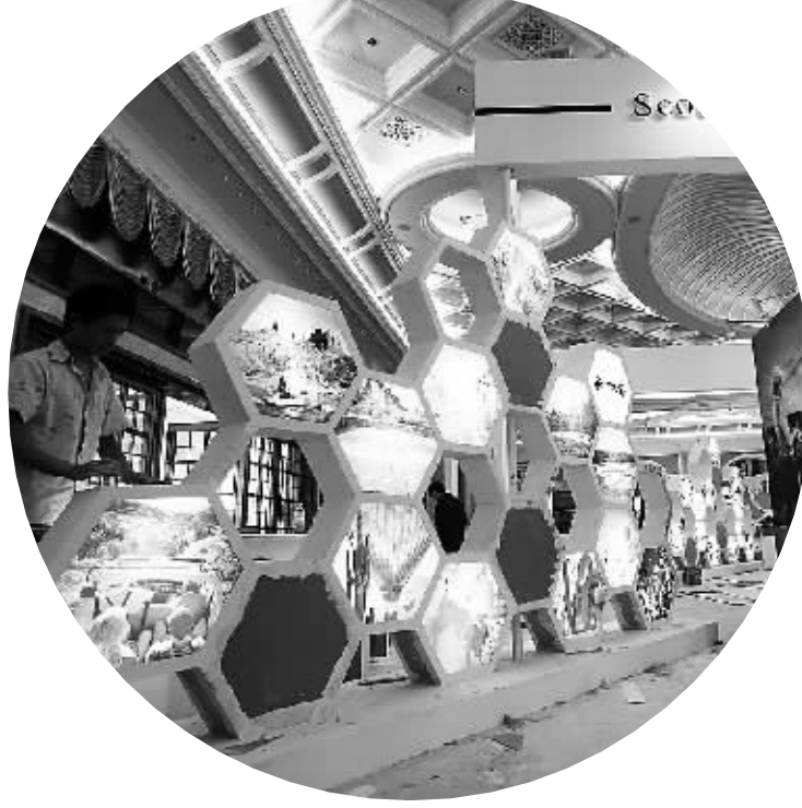
2011年体博会海南国际友好城市展区。