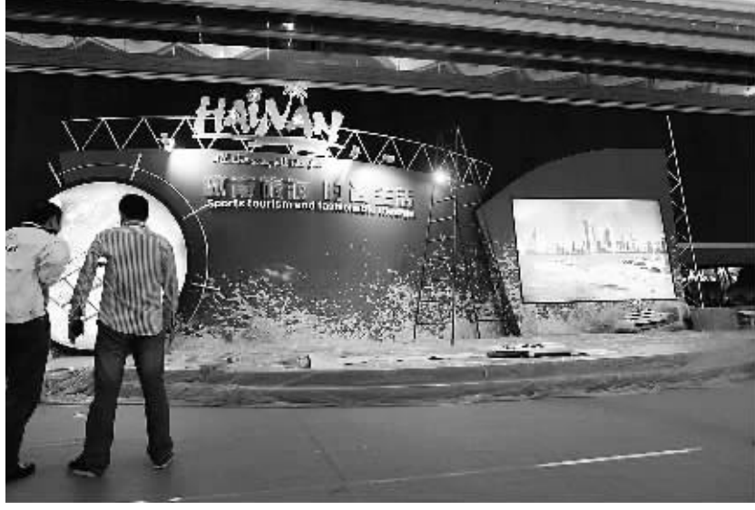
11月9日,在海南国际会展中心内,施工人员进行对2011年体博会海南国际旅游岛专题展区布展。

在45岁以上组其他比赛中,青岛队以3:1战胜海南海中华八队,粤广队1:0胜美国世界华人队。在35岁以上组比赛中,纽约华球队0:2不敌海南环球队,中华台北雷鸟队7:3海口市公安局。纽约文派佳队和中华台北雷鸟队分获两个组别的第一名。明天,本次比赛将按循环赛名次捉对厮杀,决出最后的名次。