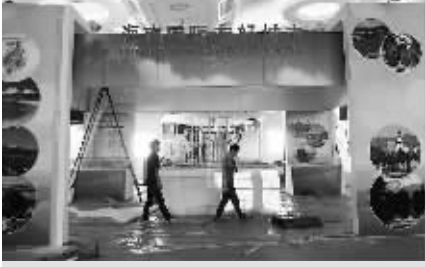
2011年体博会海南国际友好城市展区。