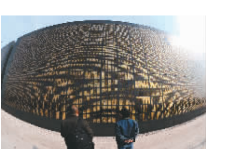
2月26日,两位年轻人在看地震纪念馆上的祭文。唐山市政府为更好地保护地震遗址,同时给广大市民提供一个祭祀地震罹难者的场所,于2008年6月动工建造的长300米的地震纪念馆即将竣工。

据新华社北京2月26日电 外交部发言人马朝旭26日就日本领导人关于钓鱼岛问题的言论答记者问时说,中方对此表示强烈不满,已向日方提出严正交涉。