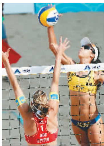
5日,巴西选手塔莉塔·达罗沙·安图内斯(右上)四号位强攻。