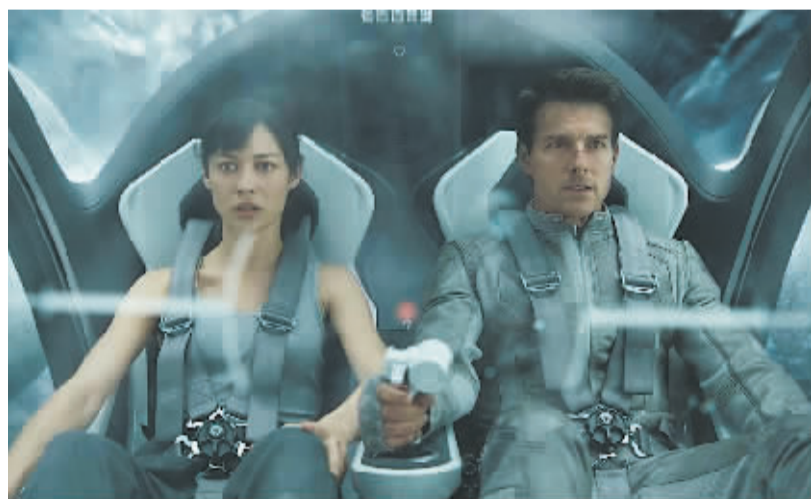
《遗落战境》中的汤姆·克鲁斯(右)和欧嘉·柯瑞兰寇

幻片中,汤姆·克鲁斯也不能少了浪漫的爱情。在被核战争摧毁的地球上,爱情之花依然能顽强绽放。当杰克遇见茱莉亚,他脑海中一段纠缠已久的记忆片段被激活了,两人被宿命般连接起来,在经历了末日洗礼的地球上,谱写了一曲令人动容的末日爱情诗:在爱情感召下,杰克开始正视自己以及这个世界,当使命召唤之时,杰克毅然为爱走上了拯救世界之路。