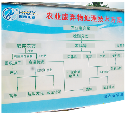
标准化深入海南正业中农高科公司生产的每一个环节。图为该公司废弃物处理流程标准。

澄迈县质监局有关负责人表示,示范区建成后,将进一步通过“公司+基地+农户+标准”的方式,发挥龙头公司在标准化示范区中的带头作用,将文儒镇打造成海南的沉香之乡,最终辐射澄迈全县及周边地区,使沉香标准化生产成为海南农民致富的新手段。