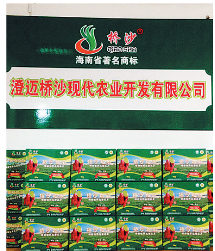
标准化是品牌化的基础。近年来,澄迈县通过大力推行农业标准化,培育一批像桥沙地瓜这样的农业品牌。