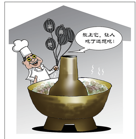
调味“秘方” 新华社发 赵乃育 作