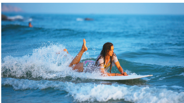
游客在万宁石梅湾享受冲浪的乐趣。

在乐东黎族自治县旅游委有关负责人看来，随着西环高铁、滨海大道等基础设施的逐渐完善，将带动乐东龙沐湾、龙栖湾、龙鳞湾、昌化江、望楼河、尖峰岭、毛公山等旅游资源的深度开发，打造山海互动复合型特色旅游。西环高铁开通后，游客从三亚往海口的第二站就是乐东，游客在三亚游玩后，可以选择到乐东的毛公