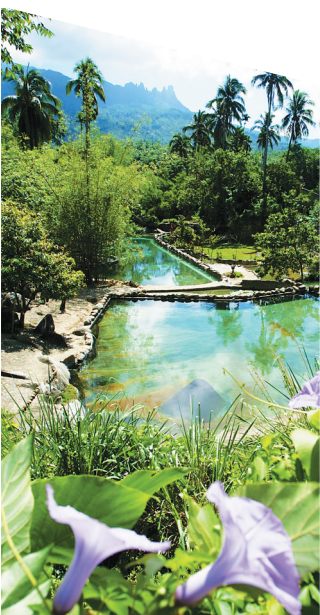
保亭七仙岭温泉。

“这得益于三亚中心价值的进一步释放，无论是‘清凉一夏·三亚度假’主题营销活动及后期系列网络推广活动，琼南市县都积极抱团，五指山的知名度和影响力也借此得到提升。”五指山旅游局局长陈键说。