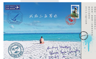
《我在三亚等你》 作者:@Madison8F