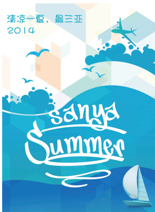
《蓝色海洋》 作者:@杨小羊