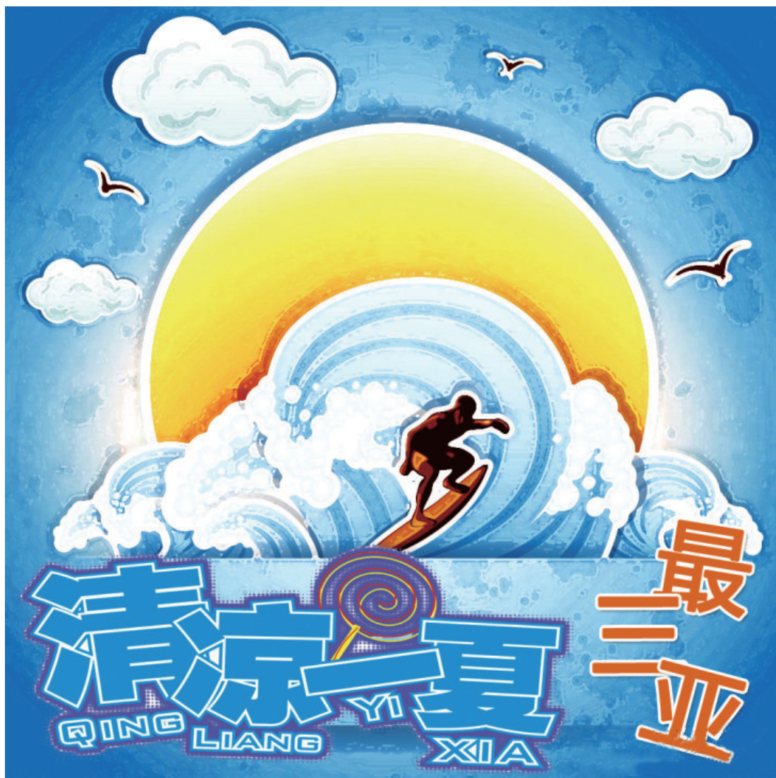
《清凉一夏 最三亚》 作者:@nmgjmw

经过近5个月的稿件征集、网络投票和评委评选,该大赛评出年度最佳创意奖1名和年度优秀作品奖10名。网友“@nmgjmw”以蓝色为主基调,以人物玩帆板为故事核心,展示三亚滨海风情的作品《清凉一夏 最三亚》成功夺冠;《蓝色海洋》、《我在三亚等你》、《夕颜》、《金色阳光》、《鹿回头》、《南海明珠》、《清凉夏》、《悠情夏日》、《纯净的天空》、《海洋气息》等作品获得年度优秀作品奖。