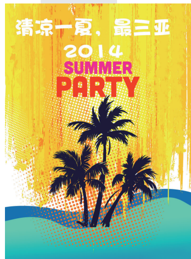
《金色阳光》 作者:@肥羊