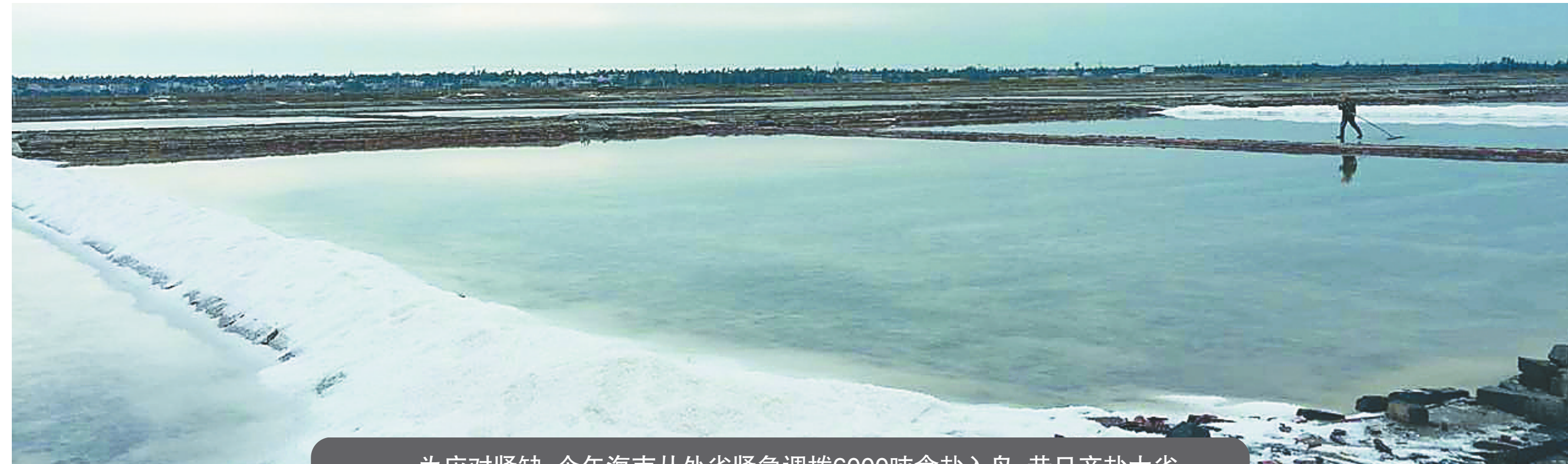
冷清的莺歌海盐场。

2016年我国将废止盐业专营，盐业经营由市场主导，然而海南盐业今后要走向何方，是否还能重新振奋崛起，我们拭目以待。