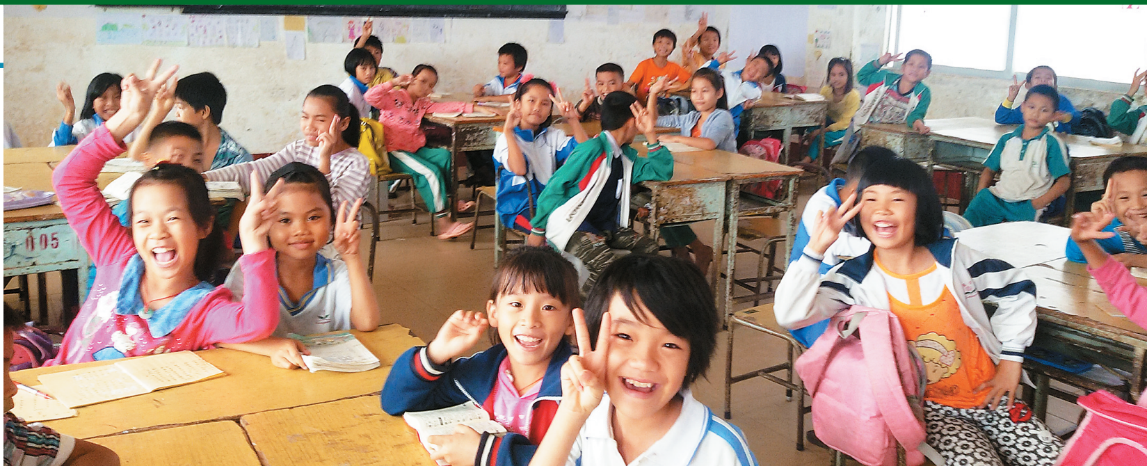
高效课堂让四(3)班的孩子们找到自信，脸上绽放出笑容。