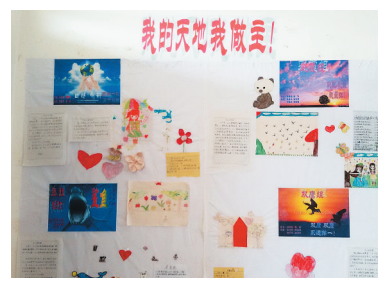
教室墙壁分成8块，交给学生去发挥。

的路面，泥泞难行，何不抬起头来，看看满天星光，它正为你照亮脚下的路。”走在路上，低下头来似乎路只有一条，抬起头来却是海阔天空。让我们一起走在路上吧！