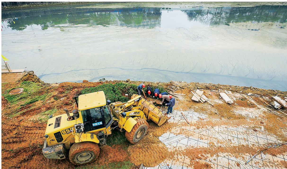
2月15日,在海口市国兴大道滨水景观带,高空俯瞰挖掘机在美舍河沿堤治理作业的情景。

另外,海口也对31个水体治理制定了明确的时间节点目标,2016年12月底前通过清淤疏浚、截污控源的工程措施,快速改善水质;2017年12月底前通过改造排水管网、建污水处理设施、实施水体生态修复等,实现水体达到V类水标准;2020年12月底实施雨污分流PPP工程,实现长效管理。 (本报海口2月15日讯)