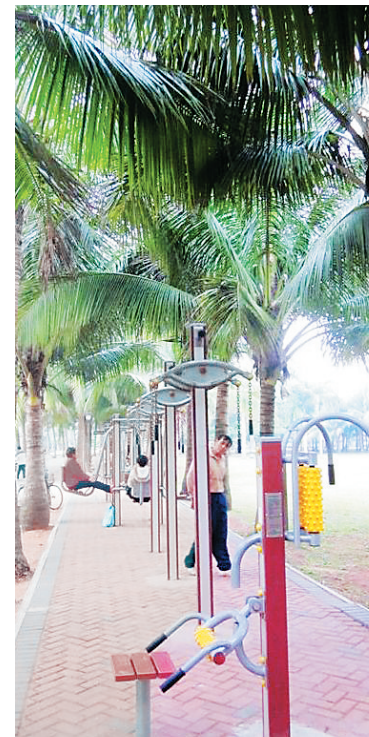
海口万绿园健身器材(资料图)

“运动健身不是简单的蹦蹦跳跳,而是一种必须讲究科学的身体活动。盲目蛮干会事与愿违,科学锻炼方可安全、高效。”省文体厅群体处相关负责人提醒,平时锻炼时,人们要以个人的体质状况、体力强弱、年龄性别、工作情况、劳动强度、生活条件以及锻炼目的为依据,制定科学锻炼计划。锻炼前,要充分做好各项准备工作。健身计划应循序渐进,运动强度应由小到大,在身体逐步适应的基础上不断提高要求,持之以恒,形成习惯。