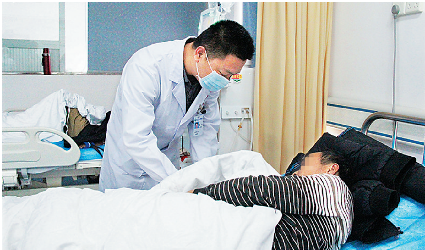
定安县人民医院血液透析室内,医生为患者诊治。