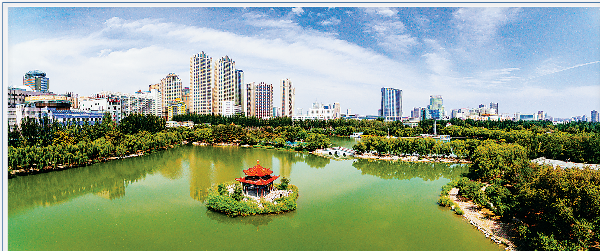
守望相助70载·壮美亮丽内蒙古 “天空之眼”瞰呼和浩特

当日,记者从公安部获悉,77名电信网络诈骗犯罪嫌疑人被我公安机关从斐济押解回国,涉及诈骗案件50余起,涉案金额600余万元。这是我国首次从大洋洲大规模押回电信网络诈骗犯罪嫌疑人。