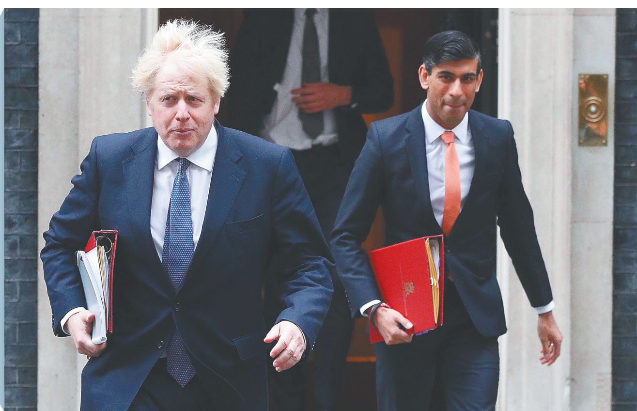
10月13日,英国首相约翰逊(左)离开唐宁街10号首相府。

英国首相约翰逊12日公布了一个适用于英格兰的三级新冠警戒系统,每一级别对应不同的疫情严重程度以及相应的应对措施,以进一步规范和简化英格兰各地落实疫情防控措施的程序。 约翰逊警告,英国新冠疫情已经如同“一架处于险情中的客机”。