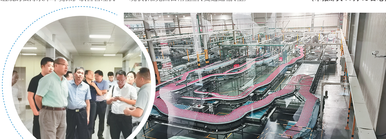
儋州市人大考察组考察农夫山泉公司。 特约记者 李珂 通讯员 温冬雁供图