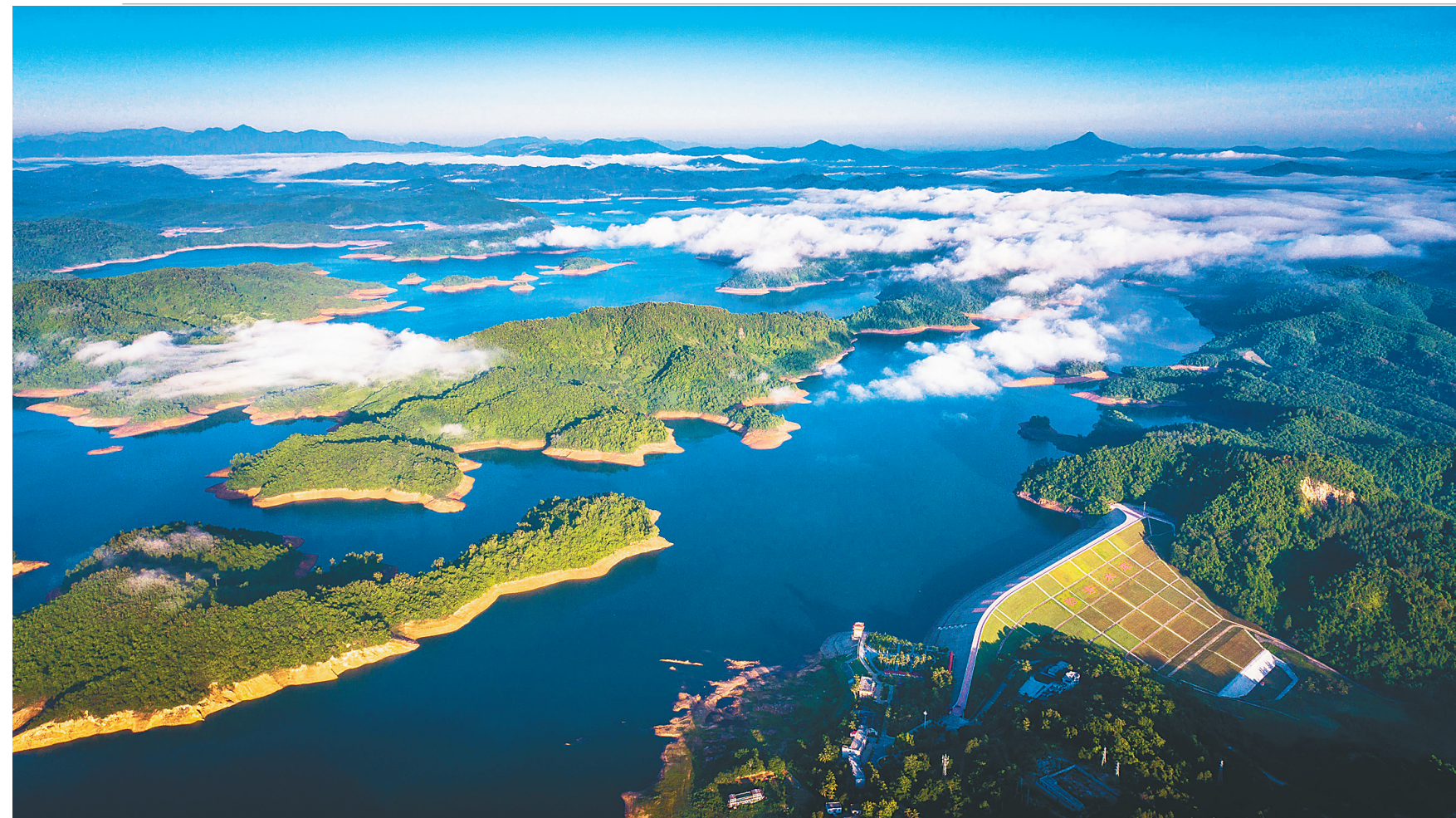
俯瞰松涛水库。