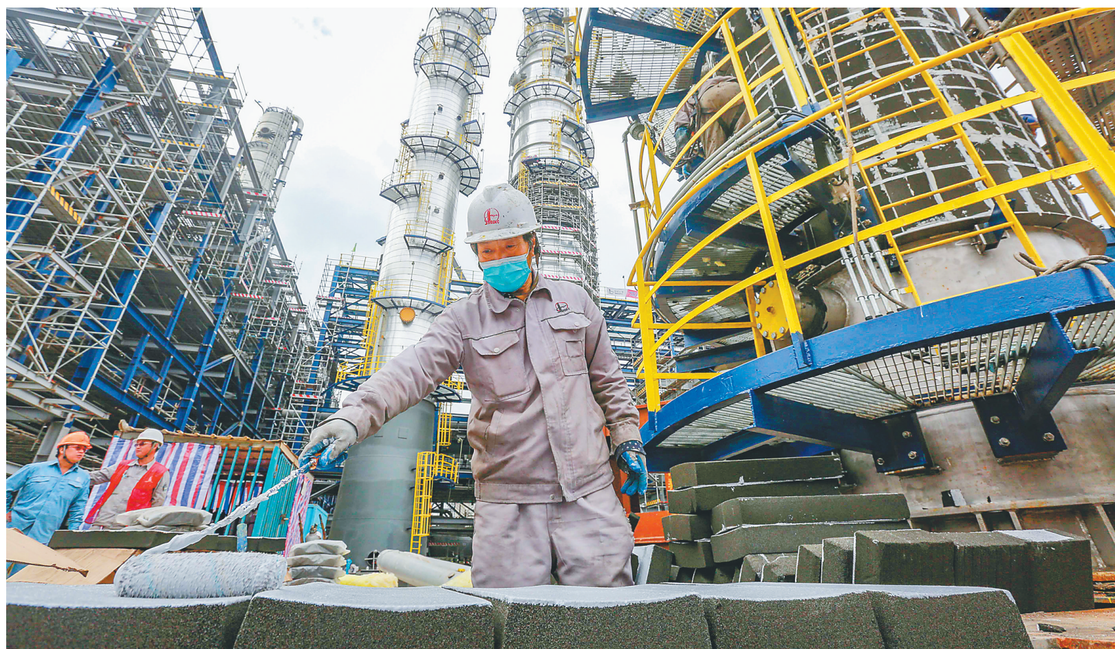
海南炼化100万吨乙烯项目加紧施工

下一步,我省将推动禁燃禁放管控工作进一步细化责任到人,实施三级网格化管理;强化烟花爆竹储、运、销源头管控;并将指导督促各市县组织公安、应急、生态环境、市场监管等部门开展联合执法,加大执法检查的频次和力度,既要严格管理,又要人性化执法,及时劝阻群众在禁燃区燃放烟花爆竹的行为,减少烟花爆竹燃放给空气环境带来的污染。