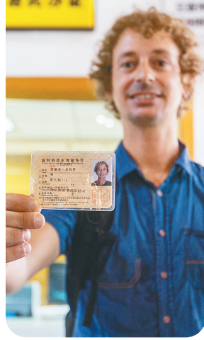
三亚此前颁发的第一张外国人临时驾照。