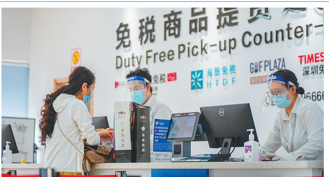
带上免税品回家 5月23日,在海口新海港码头内的海南离岛免税提货中心,工作人员为顾客办理退税和提取免税商品。截至今年一季度,海关共监管销售离岛免税品1.95亿件,购物人数2926万人次。