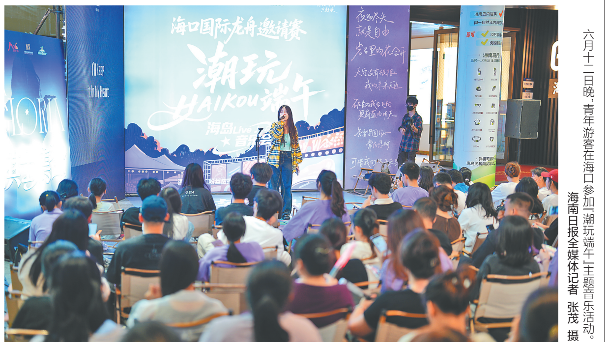
六月十二日晚，青年游客在海口参加“潮玩端午”主题音乐活动。

惠，单人特惠票66元，双人同行仅需126元。海南长影奇幻乐园则推出学生持准考证或毕业证加身份证免费入园活动，并提供单人59.9元、双人69.9元的6项游乐套票。6月10日至8月30日期间，海口市国家帆船基地公共码头推出毕业季同行优惠，2人同行帆船体验仅需68元/人，包船368元/艘。