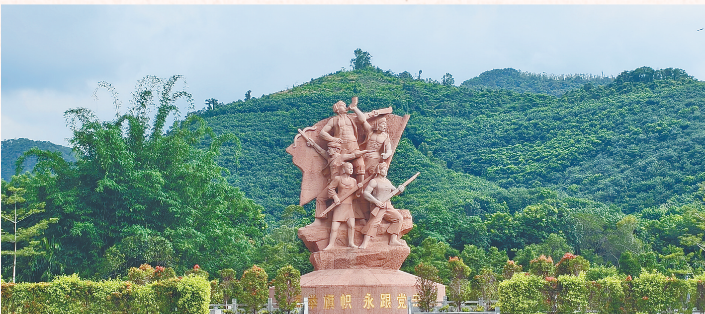
位于白沙黎族自治县元门乡向民村的“白沙起义第一枪”旧址纪念馆。