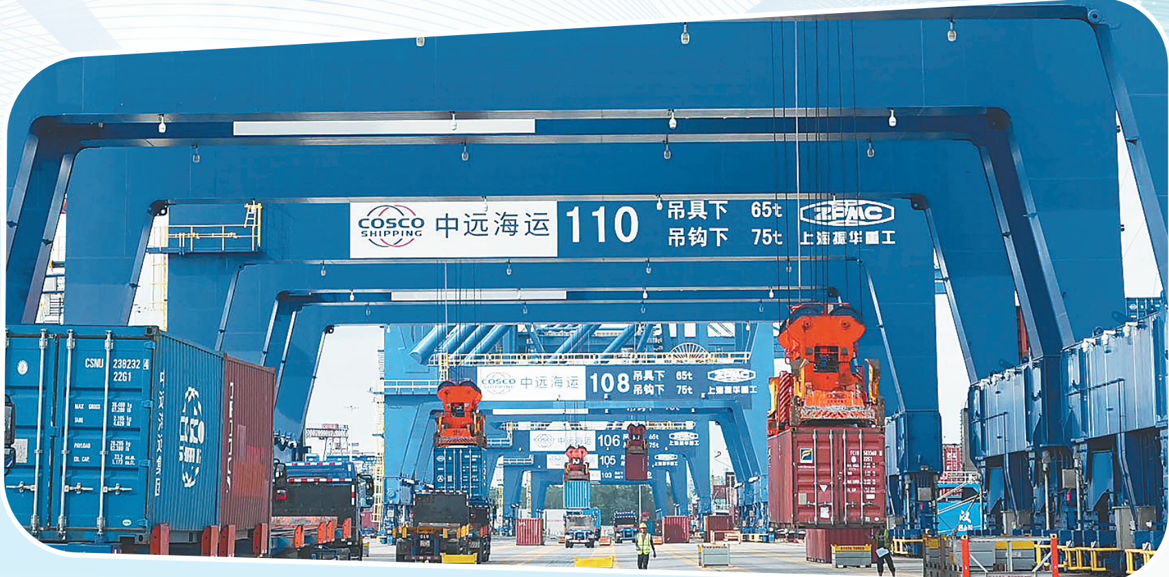
在洋浦国际集装箱码头，工作人员调度岸吊吊运集装箱。

目前 全岛8个对外开放口岸高效运行 10个“二线”口岸运转良好 进口货物平均通关时间压缩20% “二线”出岛货物申报项目 简化60%以上 超10万家外贸主体纳入 信用通关分级分类管理 封关以来截至2026年5月31日 进出境旅客总计138.5万人次 同比增长31.8% 其中 免签入境旅客35.2万人次 同比增长42.4% 进出境航班9948架次 增长28.8% 船舶2334艘次 增长12.2% 制图/杨千懿