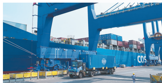
近日，海南港航物流有限公司一批货物通过“径予放行”模式顺利通关。

相较于以往人工逐一审核、多层级流转审批的传统模式，全新的“径予放行”模式依托大数据、智能监管技术，实现全流程智能化闭环办理，全程仅四步即可完成通关。企业在单一窗口提交申报