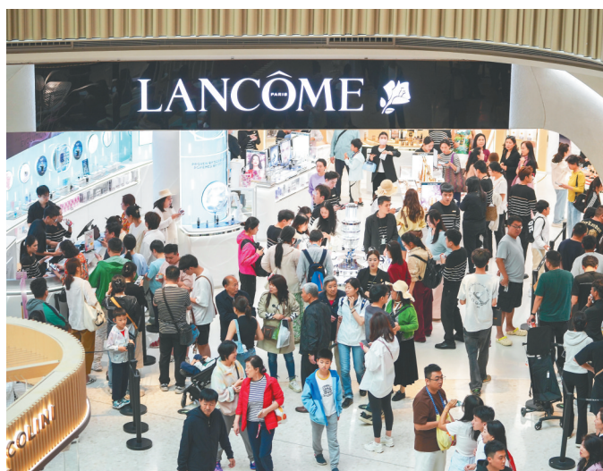
市民游客在cdf三亚国际免税城选购免税商品。

在国药中服免税三亚店，新近打造的萌宠馆汇集了全球宠物食品、玩具，将宠物消费纳入免税渠道，顺应市场发展需求。