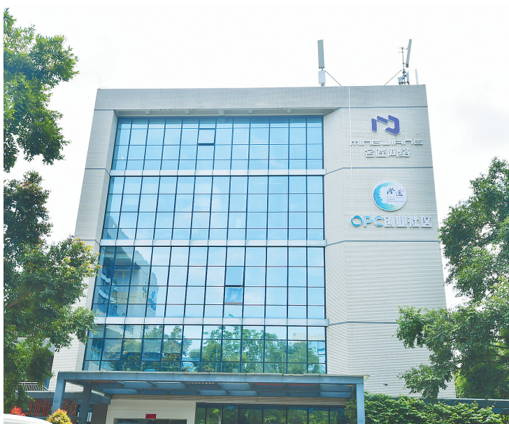
澄迈 OPC 创业社区。