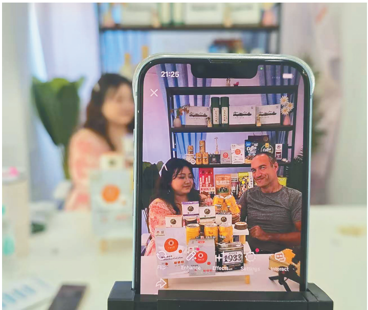
位于老城科技新城的起梦跨境电商出海园区，外籍主播贴合欧美、