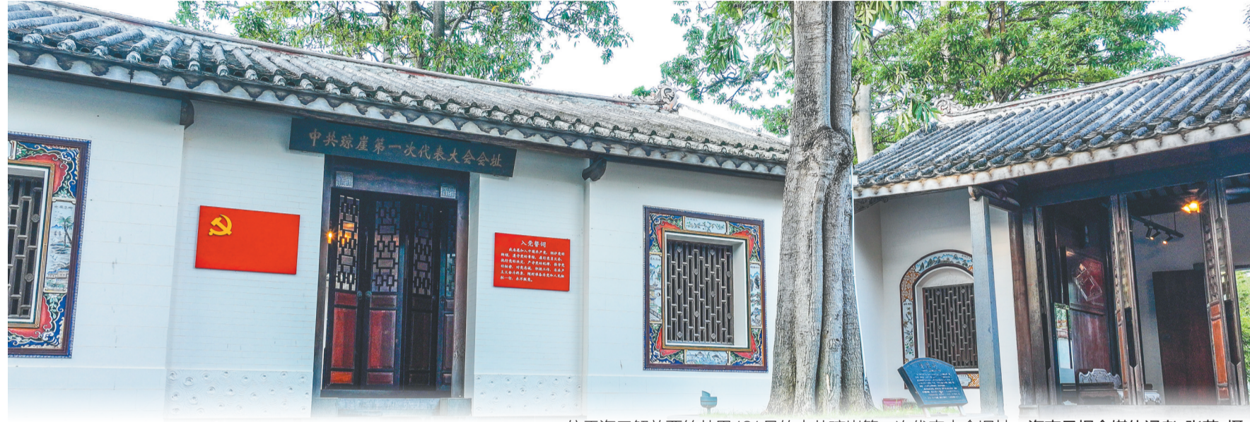
位于海口解放西竹林里131号的中共琼崖第一次代表大会旧址。

会议选举产生了第一届委员会,罗汉担任支部书记,王文明、冯平、李爱春、何毅、符向一、柯嘉予、陈公仁等8人当选为委员。成立大会结束后,支部成员们兵分多路,奔赴全岛。他们一边按照国共合作的要求协助发展国民党组织;一边秘密播撒革命火种,大力发展共产党的力量,让红色基因在琼崖大地快速生根发芽。