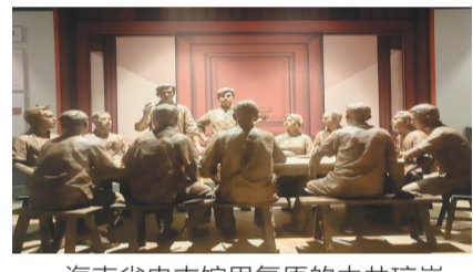
海南省史志馆里复原的中共琼崖一大会议场景。