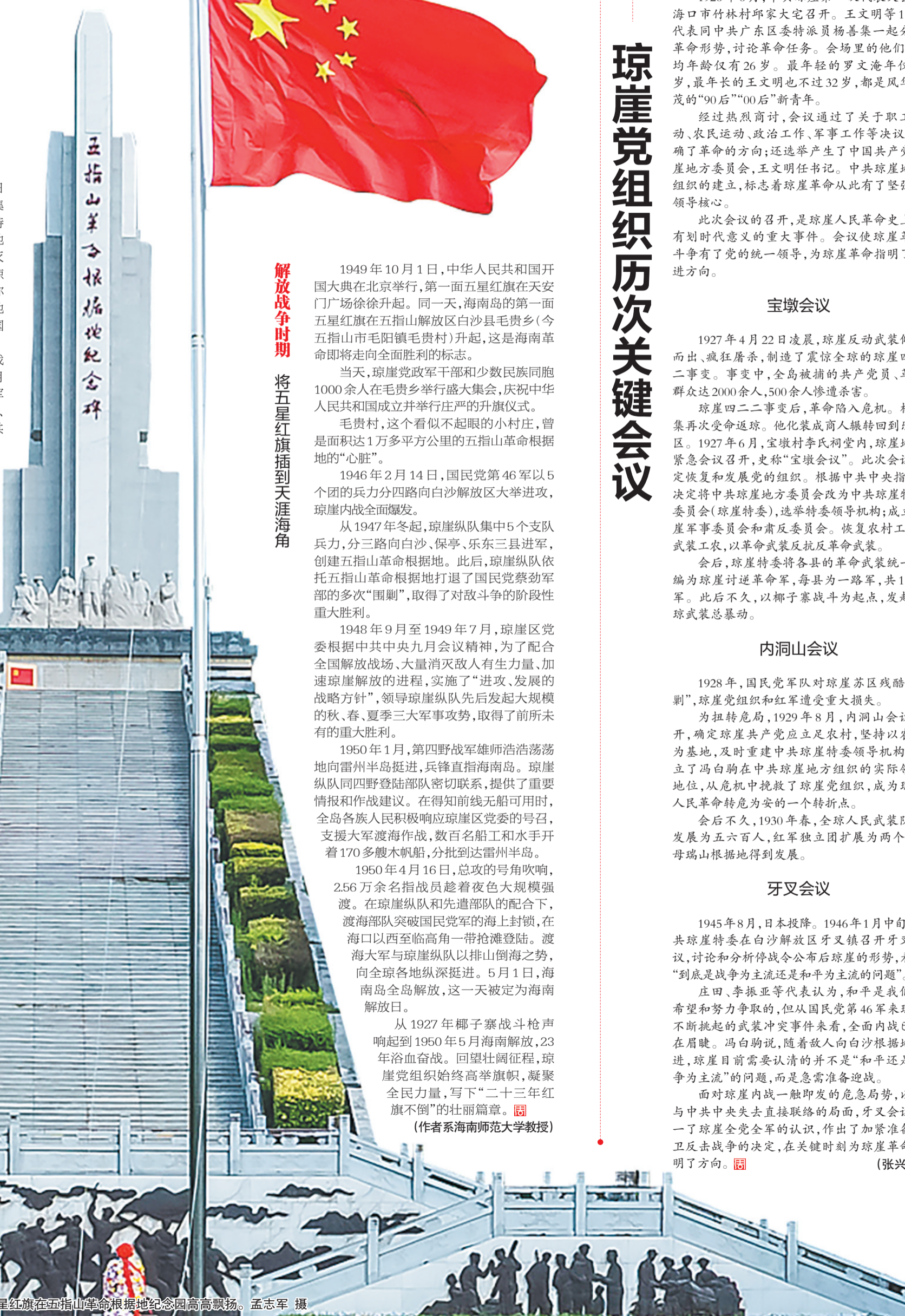
五星红旗在五指山革命根据地纪念馆园高高飘扬。孟志军 摄

日，国民党琼崖当局置抗日大局、民族大义于不顾，纠集3000余人的兵力向琼崖特委、琼崖抗日独立总队驻地美合村猖狂进攻，企图消灭琼崖人民抗日武装，破坏琼崖抗日民族统一战线，史称美合事变，美合抗日根据地遭受严重摧毁，标志琼崖国共合作的决裂。日文资料《海南警备府战时日志》记载，1942年10月的海南岛上，共产党领导的军队为6915人，国民党保安团、守备团合计4710人。中国共产党领导的琼崖抗日力量已经超过国民党军，成为日军在海南岛最主要的“讨伐”目标。抗日局势急转直下，琼崖抗日武装陷入日军疯狂“扫荡”，国民党顽军蓄意夹击的双重绝境。纵使孤立无援、物资极度匮乏，琼崖党组织始终初心不改、旗帜不移，紧紧团结各族群众，依托深山密林、根据地坚持艰苦卓绝的抗日斗争，武装队伍不断扩大。