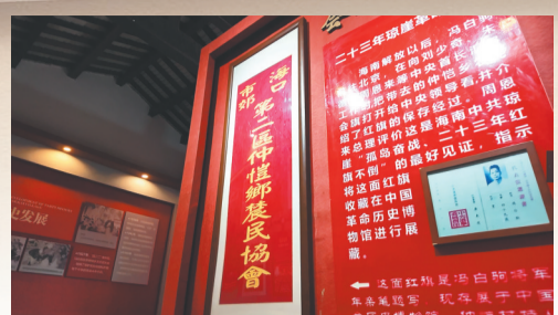
“海口市郊第二区仲恺乡农民协会”旗帜(复制品)。