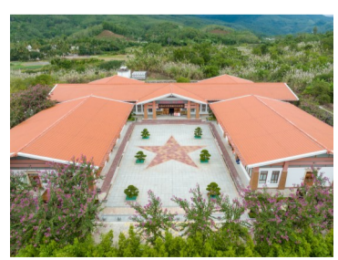
俯瞰五指山革命根据地纪念馆园里的陈列馆。

三面旗帜，三个不同历史时期，在孤悬海外、四面受敌的绝境、险境中，中共琼崖地方组织始终高举革命旗帜，带领琼崖军民书写中国革命史上独一无二的孤岛斗争史诗。