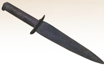
陵水档案馆珍藏的彭谷园战斗匕首。

1927年11月，讨逆革命军改编为琼崖工农革命军，1928年2月整编改称琼崖工农红军。1930年8月，在母瑞山组建琼崖工农红军独立师，后正式定名为中国工农红军第二独立师。历经多次残酷反“围剿”战斗，1936年整编为琼崖工农红军游击队司令部。