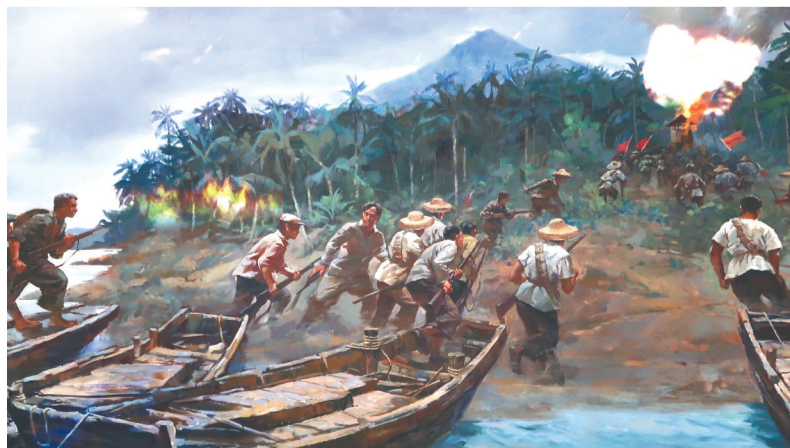
画作中的椰子寨战斗场景。资料图