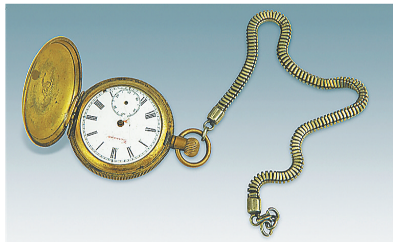
民国时期南洋琼侨赠予冯白驹的怀表。

正确男女关系的不良作风”“建立严格的管理制度,克服贪污舞弊腐化现象”。这对于发展革命力量,巩固和扩大根据地起到了很大作用。