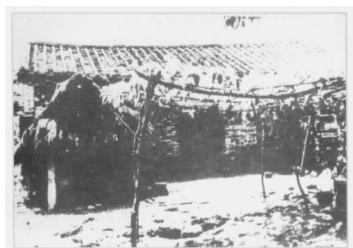
六连岭根据地中共万宁县委机关旧址。