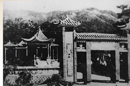
五指山市(今属乐东县番阳乡)复办的琼崖公学旧址。 资料图