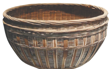
王文明夫人用过的针线竹筐。