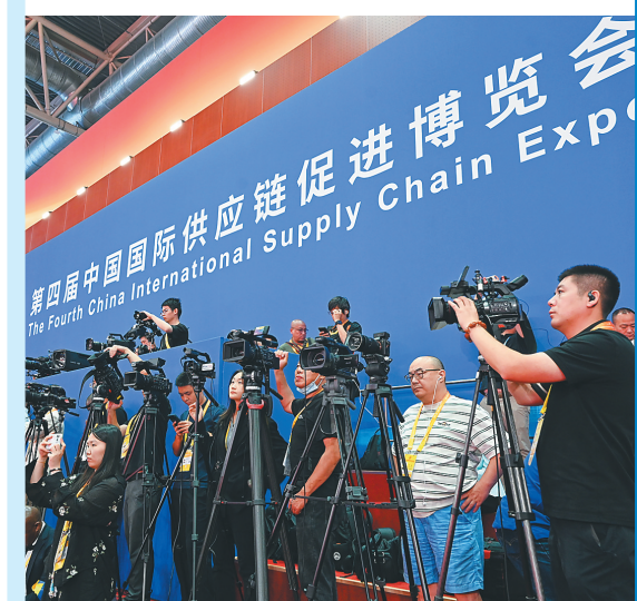
链博会现场,摄影记者架起“长枪短炮”。