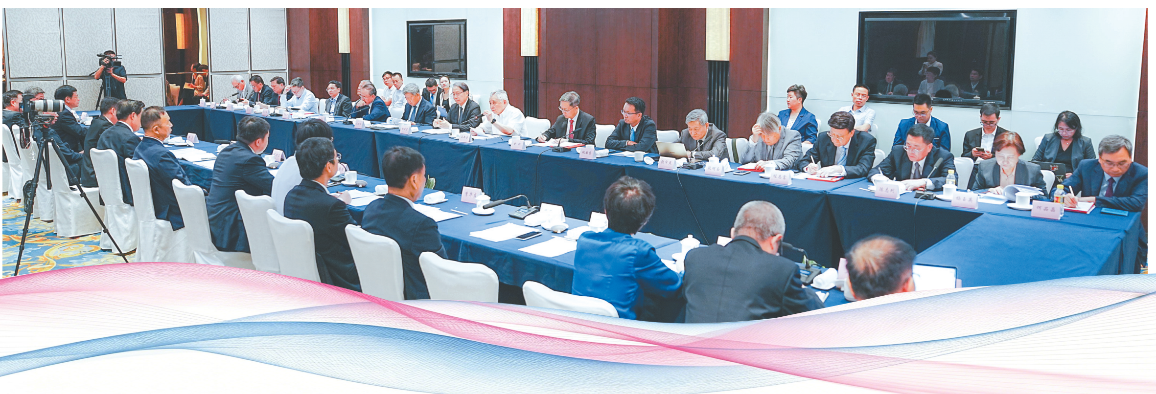
六月二十四日上午,海南自由贸易港国际咨询委员会委员聘任仪式暨第一次咨询活动在海口举行。